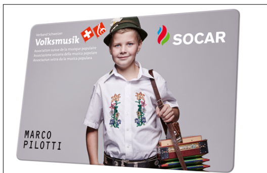
La nouvelle carte SOCAR au design spécial de l'ASMP

Download-Link: https://www.vsv-asmp.ch/media/filer_public/ca/5b/ca5b4909-5e86-47d8-8f84-229816d65737/socar-kampagne.png