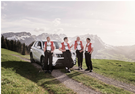
Musiciens en route pour donner un concert

Download-Link: https://www.vsv-asmp.ch/media/filer_public/ca/5b/ca5b4909-5e86-47d8-8f84-229816d65737/socar-kampagne.png